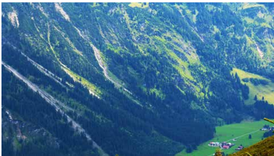
BWO-Projektgebiet Anatswald-Leiterberg vom Fellhorn(Herzrücken) aus gesehen: Der nördliche Teil des Hangs wurde durch Naturkatastrophen – Sturm, Käfer – in den Jahren ab 1992 teilweise entwaldet. „Die Fichte hat sich aufgelöst.“ Im südlichen Bereich oberhalb des Weilers Birgsau (im Bild rechts unten) geht es darum, durch vorbeugende Maßnahmen die Schutzfunktion des Bergwaldes zu erhalten und Schäden zu vermeiden.

tun wolle, eine „Aktivierung“ des Projektgebiets Anatswald-Leiterberg zu ermöglichen. Der Beiratsvorsitzende, der Oberallgäuer Landrat Anton Klotz, gab das Motto für die weitere Arbeit aus: „Die BWO ist eine Generationenaufgabe, bei der alle mitziehen müssen und bei der kein Ende festgelegt werden kann. Wir müssen weitermachen. Profitieren werden dann unsere Enkel.“ Voraussetzung dafür ist laut Beirat Kontinuität beim Personal. Deshalb die Forderung an die Politik: Festanstellung der BWO-Mitarbeiter statt Zeitverträge. Es braucht halt Ausdauer.