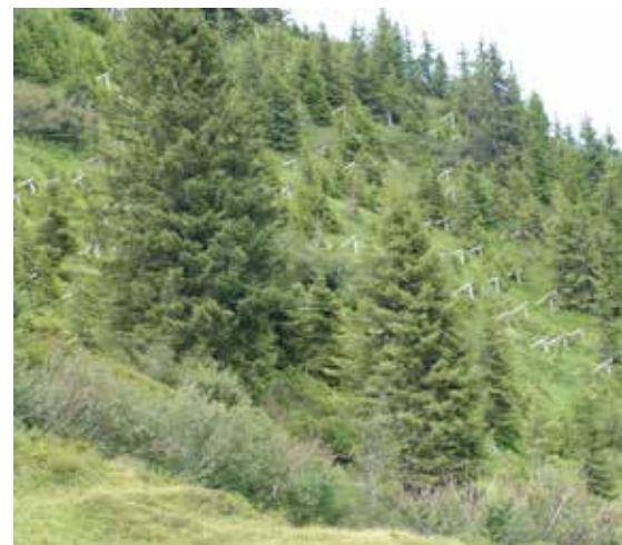
Schutzwaldsanierungsfläche Herzrücken: Im Bild der ehemalige Lawinenanrissbereich (oberhalb der Gaststätte Laiter), der inzwischen mit temporären Verbauungen und Aufforstungen – an dieser Stelle standortgemäße Fichten – geschützt ist.