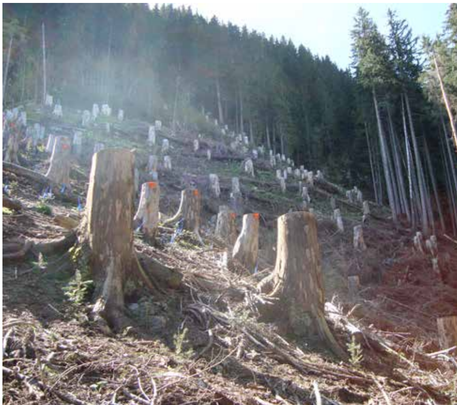
So sah die Fläche oberhalb Wagneritz im Mai 2012 aus. Zur Unterstützung der Naturverjüngung wurden 550 Fichten, 150 Tannen und 150 Buchen gepflanzt.