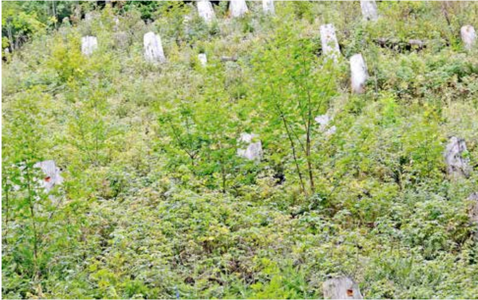
So sieht die Fläche oberhalb Wagneritz heute aus. Die Freude bei allen Beteiligten ist groß. Der für Wagneritz existenzielle Waldumbau kommt wie gewünscht voran. Ohne den vorbildlichen Einsatz der Jägerschaft sähe es am Grütenordhang ganz anders aus.

ten und Bergahorne. Diese Fläche wird Teil eines klimatoleranten Bergmischwaldes sein, der auch in Zukunft Wagneritz schützt. Der Anfang ist gemacht. Und aller Anfang ist bekanntlich schwer. Boden, Hangneigung (der Grüten-Nordhang ist teilweise sehr steil bis senkrecht), Höhe (hier 1.300 Meter), Kleinklima, Geologie, alles macht an solchem Ort Waldbau deutlich anspruchsvoller als im Tal. Nichtstun ist keine Alternative. Denn dann müssten die Einwohner von Wagneritz früher oder später ihre Heimat verlassen. Mit dem natürlichen Absterben der (schon sehr alten) Fichtenbestände wären sie schutzlos Steinschlag und Lawinen ausgesetzt.