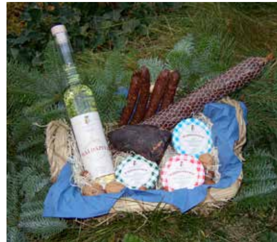
Ein Korb voller Wild-Wurst-Spezialitäten. Das wohlschmeckende Geschenk – nicht nur zur Weihnachtszeit.