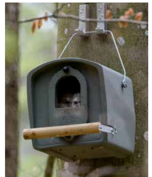
Die LBV-Kreisgruppe Kempten-Oberallgäu hat zusammen mit einer Fachfirma spezielle Nistkästen entwickelt. Die beiden Jungvögel finden sie offensichtlich gemütlich.

*LBV steht für „Landesbund für Vogelschutz in Bayern“. In den anderen Bundesländern kümmert sich der NABU, der „Naturschutzbund Deutschland“.