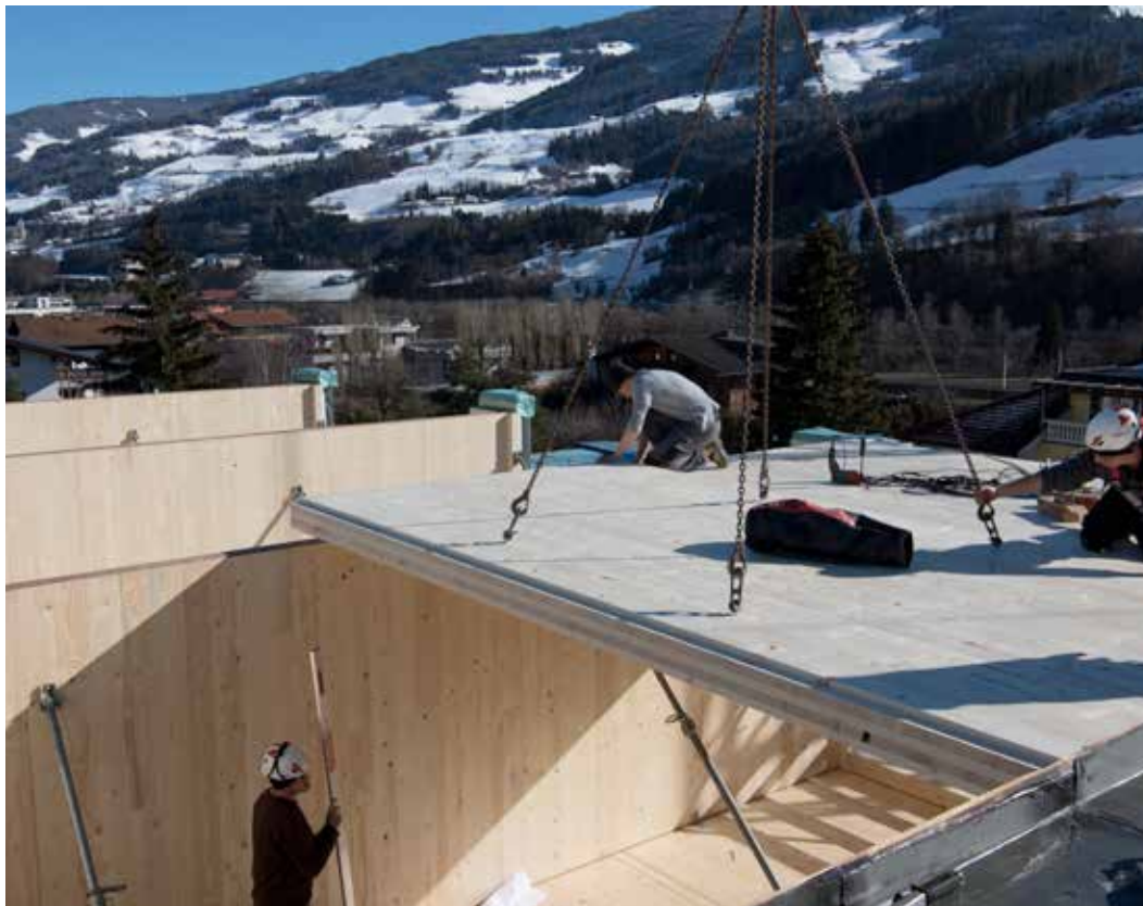
Moderner Holzbau bietet viele Vorteile. Beim Verhältnis Festigkeit zu Gewicht ist Fichtenholz sogar Stahl überlegen.

G eht doch. Und gut auch noch. Mit knapp zehn Millionen Schweizer Franken und 100 Tonnen Holz kann man einen Konzertsaal für 1.220 Besucher bauen – als „Box in der Box“. Die Kritiker loben die gute Akustik, die „schlichte Schönheit“. „Und es riecht herrlich nach Fichte“, begeisterte sich die Süddeutsche Zeitung . Fichten müssen nicht als Euro-Paletten enden.