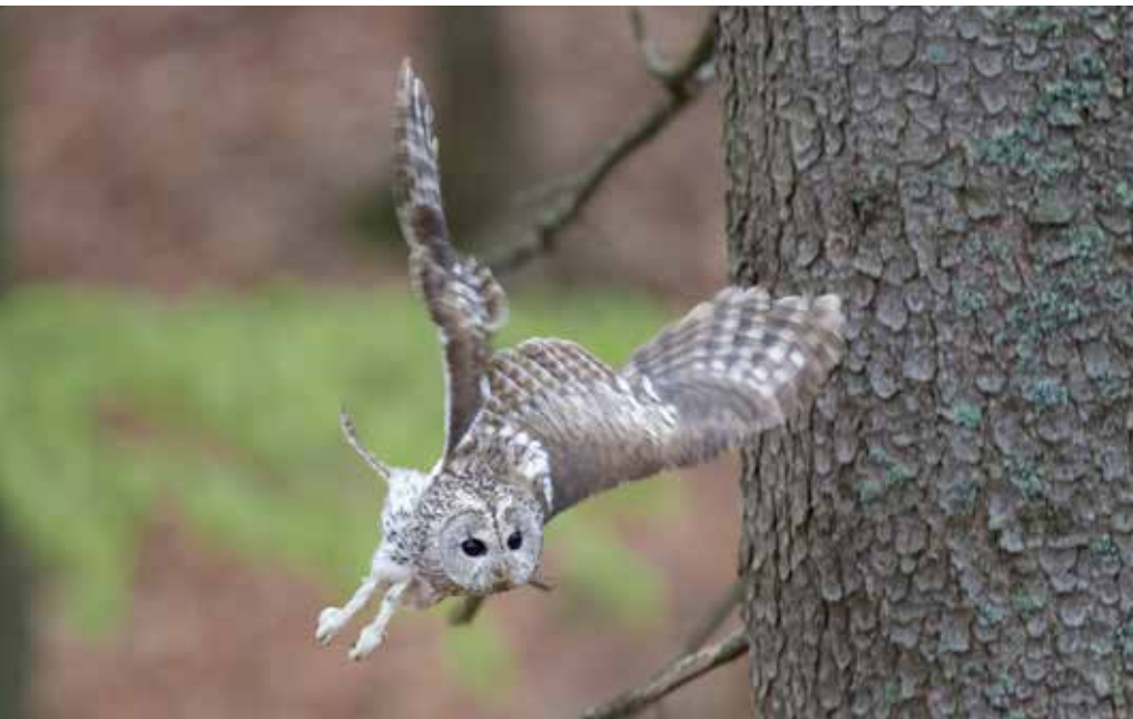
Was für ein schöner Anblick – und was für ein seltener. Am Tag verhalten sich Waldkäuse normalerweise eher ruhig.

I mmer dann, wenn es in Krimis spannend bis unheimlich werden soll, ruft – der Uhu. Falsch! Fast immer sind es die Rufe des Waldkauzes, die Gänsehaut erzeugen (sollen). Für einen „Oscar“ nominiert wurde der gefiederte Darsteller trotzdem noch nie. Das mag daran liegen, dass die Bezeichnung „Kauz“ eine Besonderheit des deutschen Sprachraumes ist. In allen anderen europäischen Sprachen gibt es für Eulen ohne Federohren und mit rundem Kopf keine eigene Bezeichnung. Dabei ist der Waldkauz ein „überzeugter“ Europäer. Mit Ausnahme von Irland, Nordskandinavien und dem europäischen Teil Russlands siedelt er auf dem ganzen Kontinent. In Deutschland leben vermutlich zwischen 43.000 und 75.000 Brutpaare. Auch im wirklichen Leben kennt man den „Vogel des Jahres 2017“, wenn überhaupt, dann eher vom Hören denn vom Sehen. Erstens ist er nachtaktiv und zweitens schützt ihn sein Federkleid am Tag wie ein Tarnanzug. Zwar fühlt er sich von Haus aus vor allem in Laub- und Mischwäldern besonders wohl, entwickelt sich aber zunehmend zum Städter. Parks, Gärten, Alleen und Friedhöfe dienen ihm hier als Zuhause. Der im Rahmen der