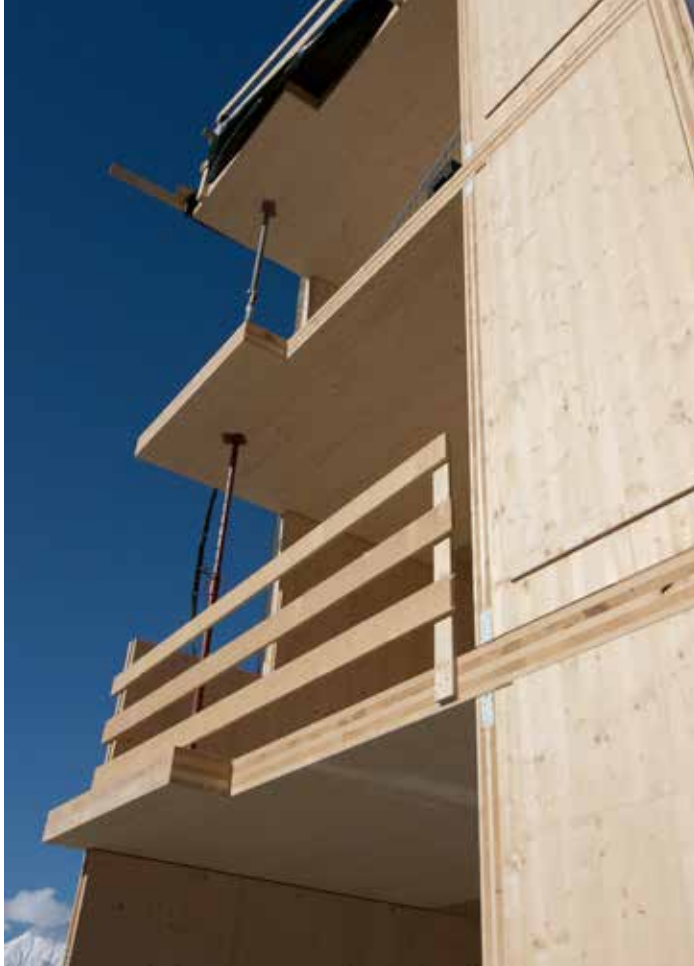
Mehrgeschossige (Fichten-)Holzgebäude könnten alltäglich sein. Sind sie aber noch nicht.