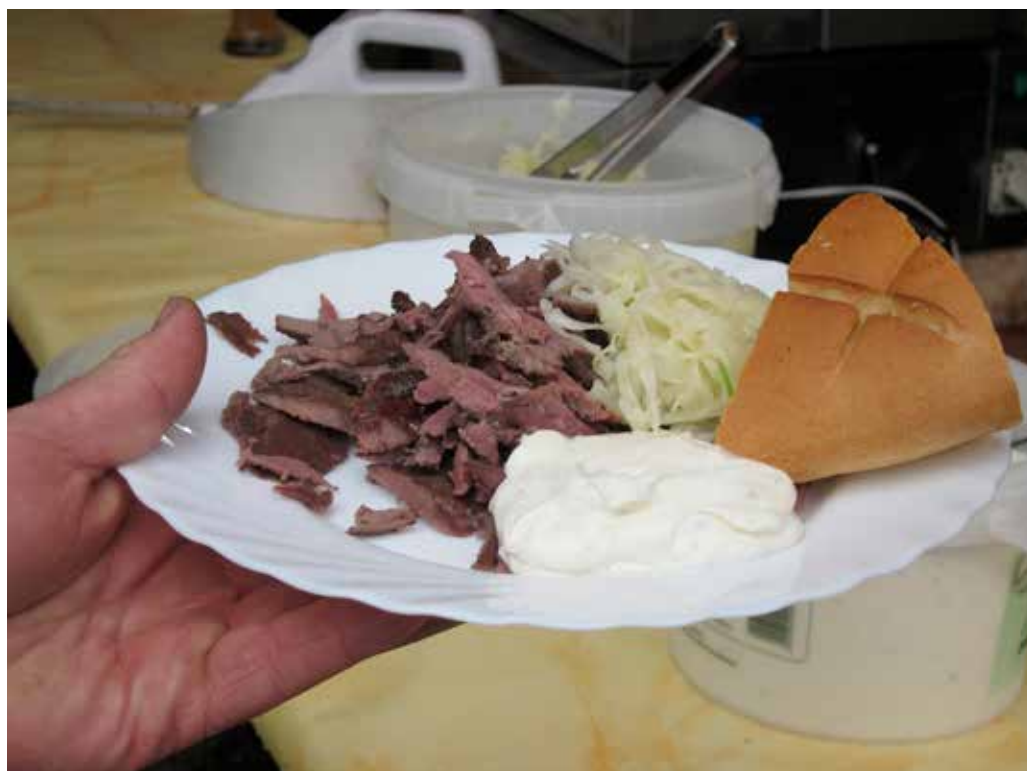
Wild-Döner gibt es noch nicht an jeder Ecke. Augen- und Magenzeugen berichten: schmeckt sehr gut.