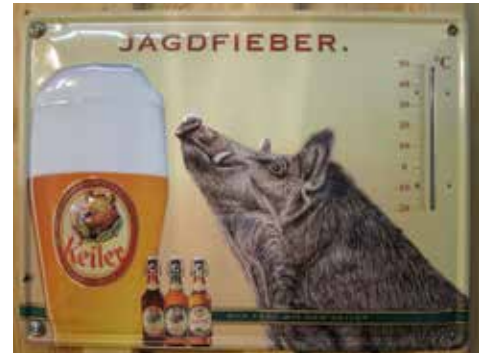
Zu Wild-Döner passt gut ein einschlägiges Bier. Diese Kombination führt allerdings nicht zwangsläufig zu Jagdfieber.

Im nächsten Bergwaldkurier: Was hat es eigentlich mit diesem „Nose-to-Tail“ auf sich und was ist der Unterschied zwischen Wildbret und Wildpret?